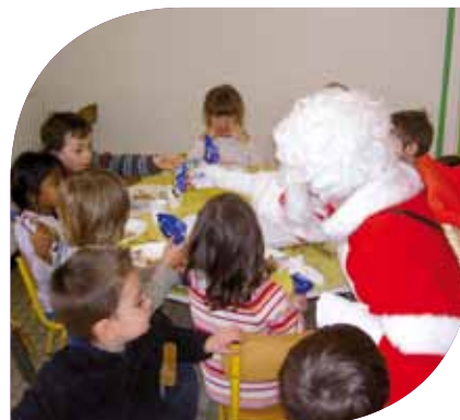
Le Père Noël au Restaurant Scolaire