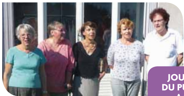
Les bénévoles du Secours Populaire Français - antenne de Chaingy