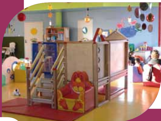
Douillet. Le repaire des « P'tits Loups », un cocon confortable et coloré.