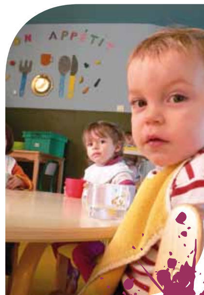
Un goûter bien mérité.

Les jeunes pensionnaires des « P'tits Loups » peuvent ensuite s'adonner, encore un peu, à un temps de jeu libre et à des activités calmes du type gommettes ou dessin... Avant de rentrer chez eux, un peu fatigués certainement, mais la tête pleine de bons souvenirs partagés !