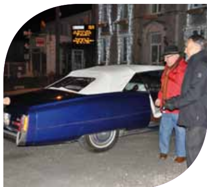
Rallye des Lumières