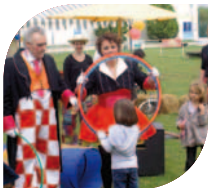
Animation cirque « Antioche et Zegora » Dimanche 2 juin