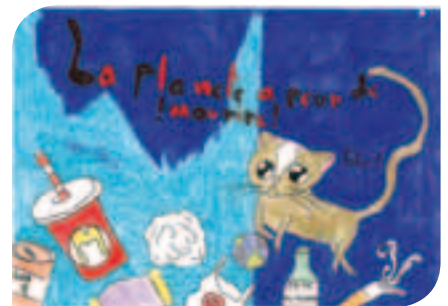
1 er prix catégorie 9-12 ans