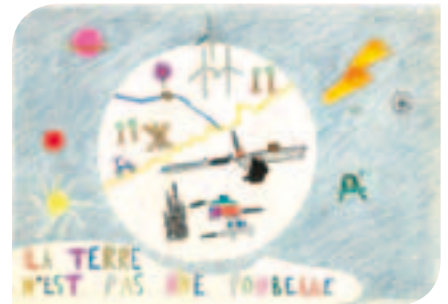
1 er prix catégorie 6-8 ans