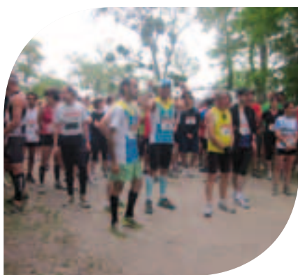
Départ de Chaingy No Limits Dimanche 27 mai