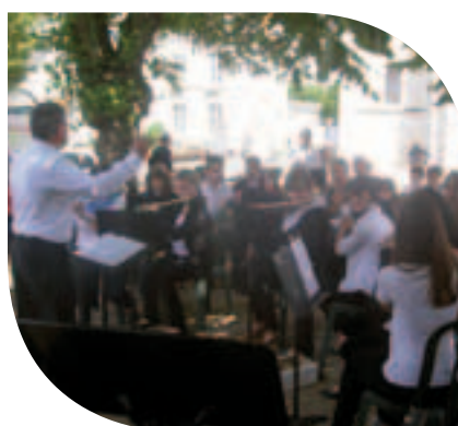
Aubade musicale place du bourg Dimanche 17 juin