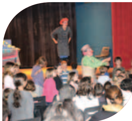
Spectacle « La Magie » Vendredi 8 juin