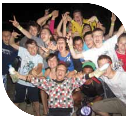
Camping de Buthiers / Club Ados et PAJ Du 16 au 20 juillet