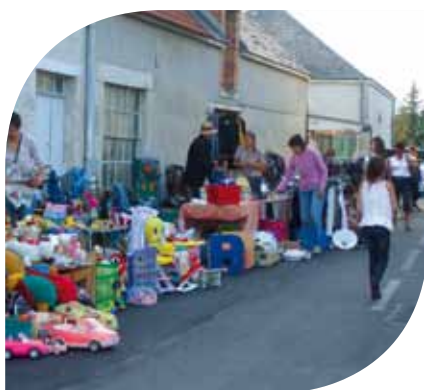
Fête du village Dimanche 16 septembre