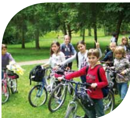
Sortie vélo du centre de loisirs juillet 2012