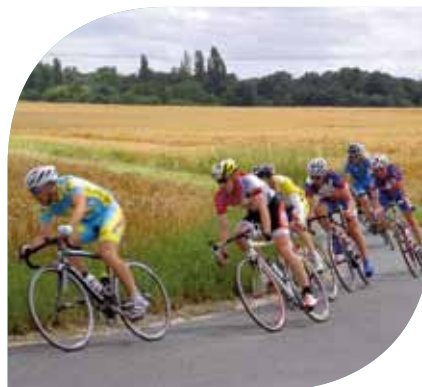
Course cycliste Dimanche 8 juillet