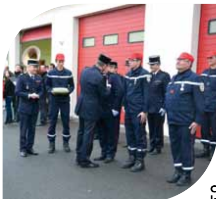
Cérémonie de la Sainte Barbe