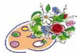
Les Jardins de Chaingy

Il nous tient à cœur de participer aux manifestations et d'y impliquer les enfants. Ils sont en général pleins d'idées et leurs parents émerveillés de leurs réalisations. Nous avons d'ailleurs nos fidèles ! Malheureusement, faute de bénévoles nous ne pourrions sans doute plus proposer d'ateliers bricolage-art floral lors de ces évènements.