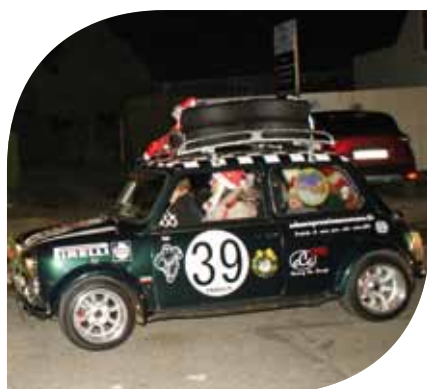
Le Rallye des Lumières