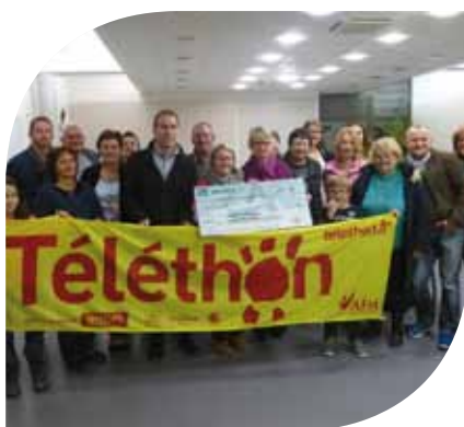
Don du Téléthon