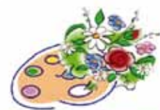
Les Jardins de Chaingy