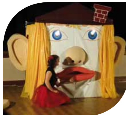
Spectacle de Noël de la Structure Multi Accueil