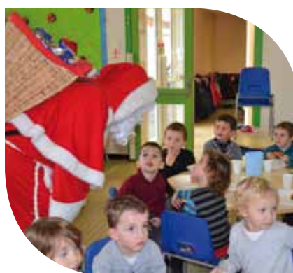
Le Père Noël au Restaurant Scolaire