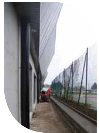
Allée d'accès aux courts de tennis