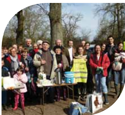
J'aime la Loire propre