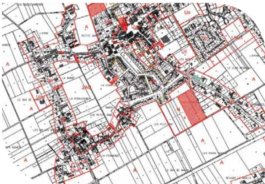
Extrait du zonage du Plan Local d'Urbanisme (PLU)

Les lois « Grenelle 2 » de mars 2012 et « ALUR » de mars 2014 intensifient encore la perspective : elles confortent la nécessité de densifier les zones urbaines et de lutter contre l'étalement urbain en préservant les zones agricoles et naturelles ; c'est aussi la rupture technologique dans les matériaux et les techniques des constructions neuves assurant la transition écologique, comme la rénovation thermique de l'habitat ancien.