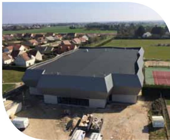
Vue d'ensemble de l'EPS