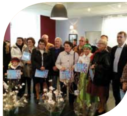
Remise des prix du concours Maisons Fleuries