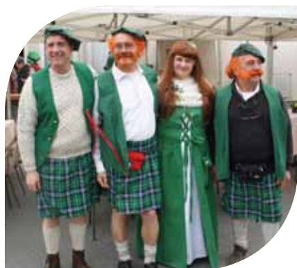
29 ème Foire Horticole et Florale