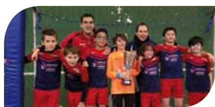
Equipe 1 : championne niveau 1 - Ligue des Champions