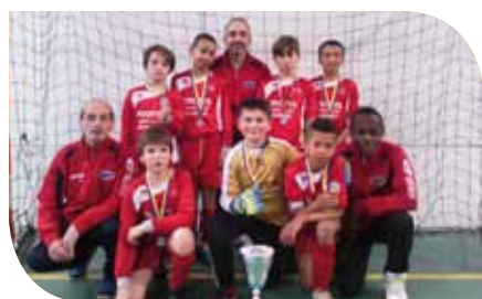
Equipe 2 : Finaliste niveau 2 - Ligue Europa

Dans le cadre de son Ecole de foot labellisée par la FFF, toujours 3 entraînements gratuits pour les nouveaux enfants. Donc n'hésitez pas à venir pour essayer sans engagement !