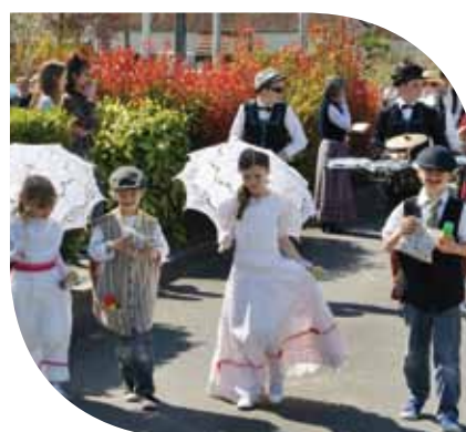
Carnaval de Chaingy La belle époque