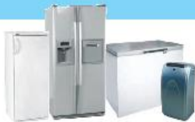
REFRIGÉRATEURS / CONGÉLATEURS / CLIMATISEURS