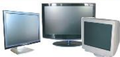
TÉLÉVISEURS / MONITEURS