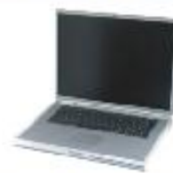
ORDINATEURS PORTABLES / ÉCRANS