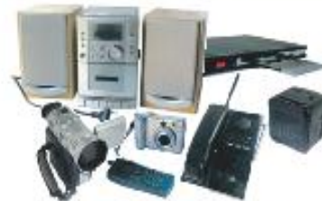
AUDIO / VIDÉO / TÉLÉPHONIE