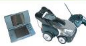
JOUETS / LOISIRS