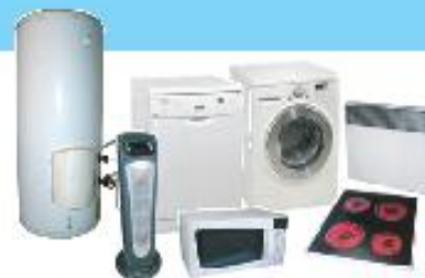
LAVAGE / CUISSON / CHAUFFAGE