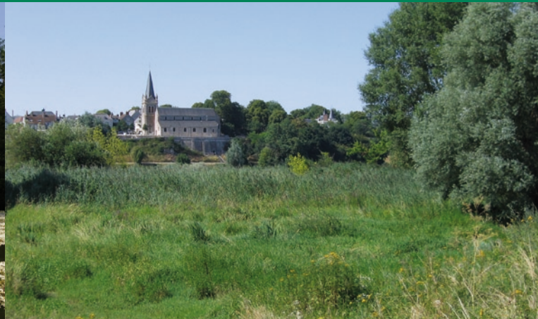
Roselière et mégaphorbiaie