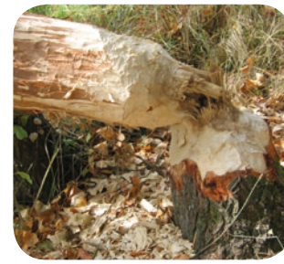
Arbre rongé par le Castor d'Europe

Située sur un axe de migration important, la réserve accueille bon nombre d'espèces d'oiseaux pour une halte plus ou moins longue. Sur les îlots et les grèves s'affairent limicoles, Mouettes rieuses, Sternes naines et pierregarin. Bruants des roseaux et Rousserolles effarvates investissent roselières ou fourrés pour y nicher. Les Rossignols et les Fauvettes à tête noire et des jardins chantent à tue-tête dans les buissons. En hiver, de nombreux Grèbes castagneux fréquentent le Loiret au côté des Canards colverts. Le Héron cendré, l'Aigrette garzette, le Martin-pêcheur et le Grand Cormoran sont visibles toute l'année. Sur les rives du fleuve, arbres rongés ou taillés en mine de crayon témoignent de la présence discrète du Castor d'Europe, espèce protégée. Dans l'eau, on rencontre l'Anguille et la Bouvière, typiques de la Loire. Le Chabot, espèce des eaux claires, est présent dans les résurgences. Saumon, Alose et Truite de mer traversent la réserve au cours de leur migration.