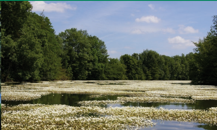
Renoncules flottantes sur le Loiret

La forêt alluviale abrite des essences étroitement liées aux variations irrégulières de la Loire : Saule blanc, Peuplier noir et le rare Orme lisse sont les fragiles témoins d'un fleuve encore relativement sauvage.