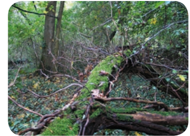
Bois mort en forêt alluviale

En bord de Loire, la dynamique de végétation est importante. Il est donc nécessaire de conserver des milieux ouverts, riches du point de vue biologique, en coupant les arbres et arbustes qui colonisent les pelouses et prairies. Dans les boisements alluviaux au contraire, les arbres grandissent, meurent, se cassent... sous le regard attentif du gestionnaire qui étudie l'évolution naturelle de la forêt. Son intervention se limite à sécuriser les chemins. Des chantiers de limitation d'espèces exotiques envahissantes (Renouée du Japon, Erable negundo...) sont organisés pour favoriser la flore autochtone.