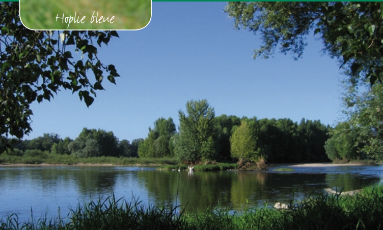
Loire et île