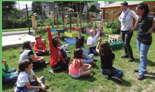
Un petit point connaissance avant de commencer !