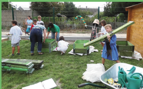
Installation des 1 ère jardinières