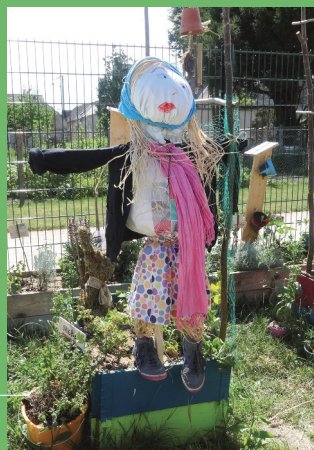
Un épouvantail made in TAP