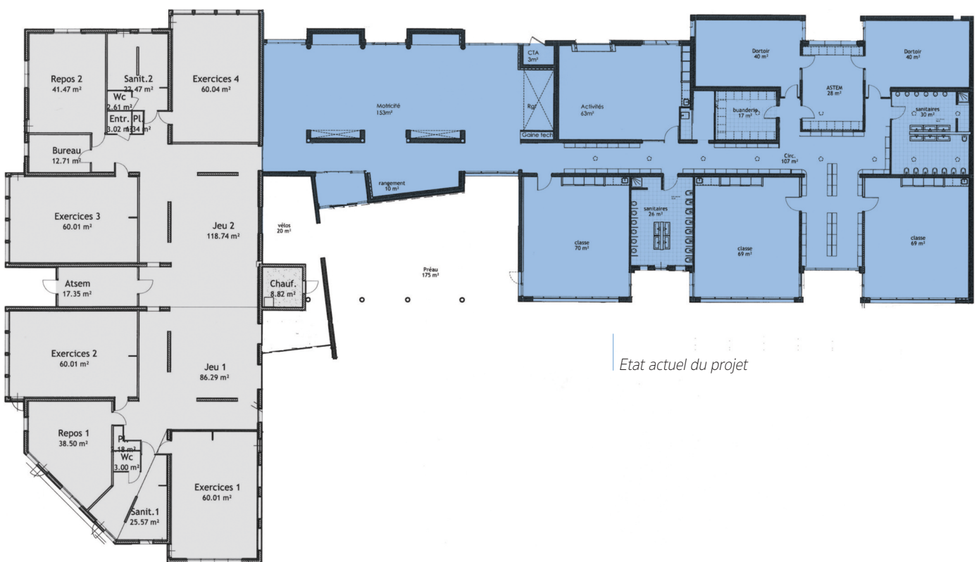
Etat actuel du projet

Coût total des travaux de construction : 1 440 000 € TTC.