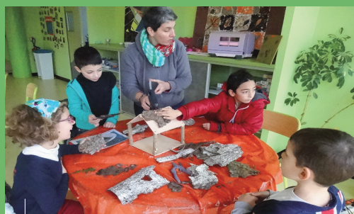
Fabrication d'une cabane à oiseaux