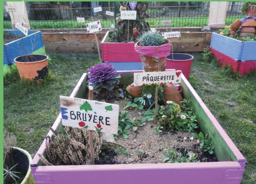
Tout pousse dans ce jardin