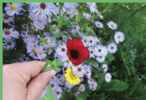
Que de belles fleurs