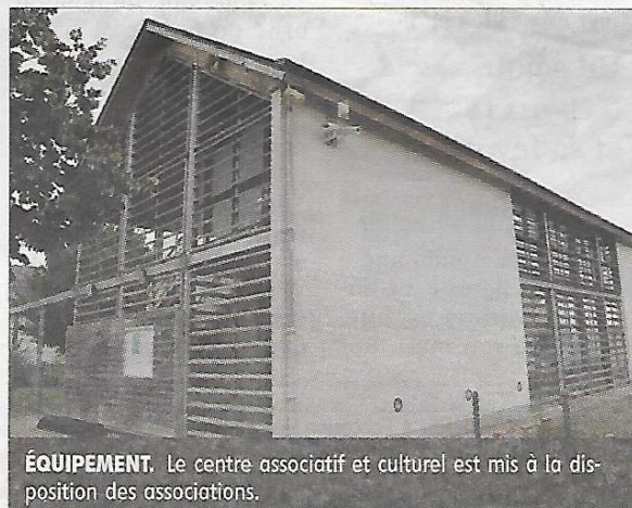
ÉQUIPEMENT. Le centre associatif et culturel est mis à la disposition des associations.